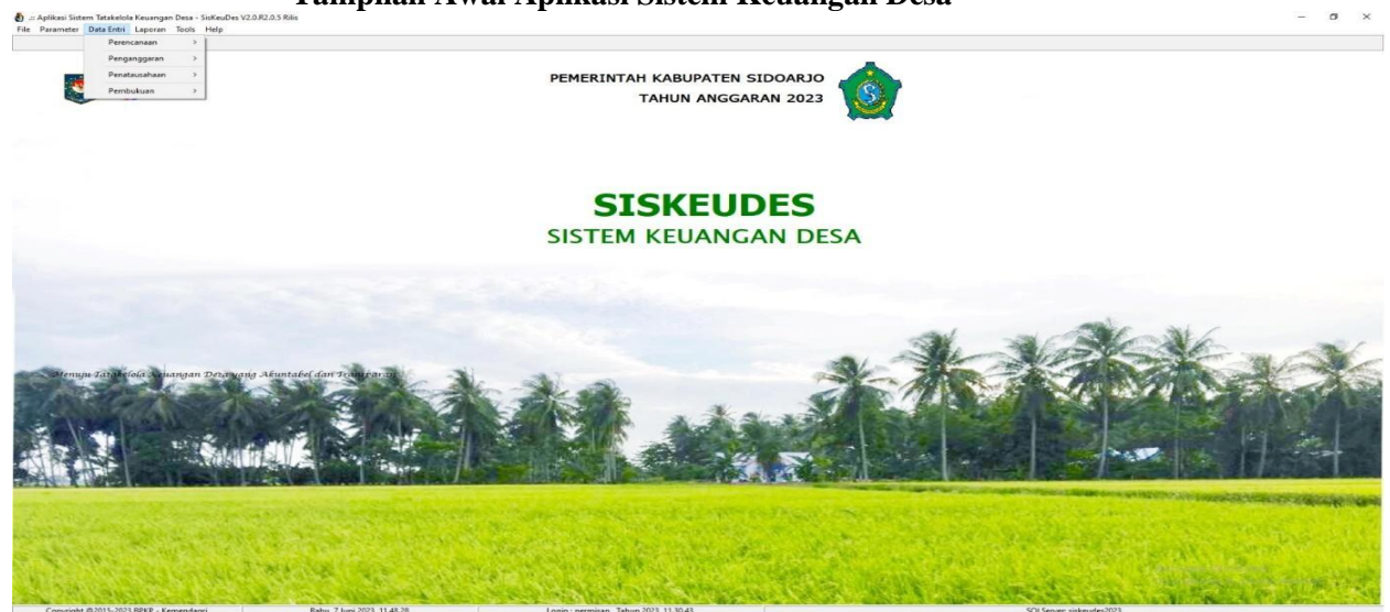
Gambar 1 Tampilan Awal Aplikasi Sistem Keuangan Desa