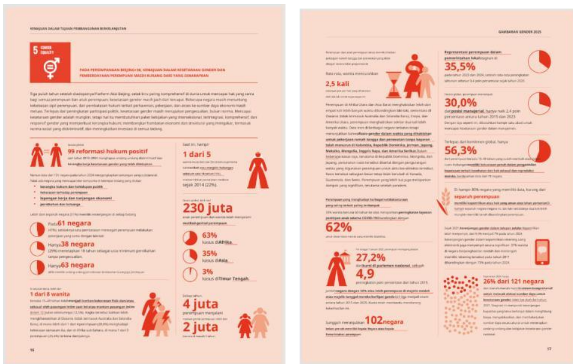
Laporan Gender Snapshot oleh United Nation (PBB), 2025

Kesetaraan gender merupakan salah satu agenda utama Sustainable Development Goals (SDGs) atau Tujuan Pembangunan Berkelanjutan yang disepakati oleh negara-negara anggota PBB, termasuk Indonesia. Kesetaraan gender sangat penting dalam mewujudkan pembangunan berkelanjutan disuatu negara (Sudirman & Susilawaty, 2022). Isu ini menempati posisi ke-5 dalam Agenda SDGs 2030, dengan tujuan mencapai kesetaraan gender serta memberdayakan seluruh perempuan dan anak perempuan. Fokus utamanya mencakup penghapusan segala bentuk diskriminasi, kekerasan, pernikahan dini, serta menjamin partisipasi penuh dan setara perempuan dalam kehidupan politik, ekonomi, dan pengambilan keputusan. Beberapa indikator kunci penentu keberhasilan meliputi revolusi digital, bebas dari kemiskinan, nol kekerasan, kekuasaan pengambilan keputusan yang penuh dan setara, perdamaian serta keamanan, dan keadilan iklim.