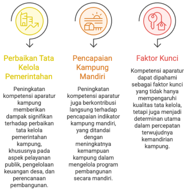
Gambar 2. Dampak Peningkatan Kompetensi Aparatur Kampung

sistem evaluasi kinerja aparatur yang terukur. Kombinasi antara faktor pendukung dan penghambat ini menunjukkan bahwa peningkatan kompetensi aparatur sangat dipengaruhi oleh sinergi kelembagaan sekaligus tantangan struktural yang masih perlu diatasi secara sistematis dan berkelanjutan.