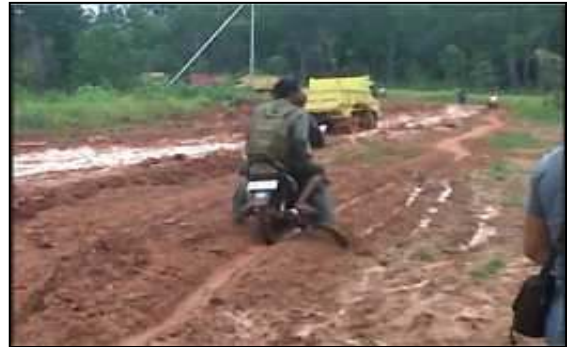
Gambar 1. Rute Jalan Merauke-Jagebob

dengan pertimbangan kawasan ini memiliki potensi lahan datar dan subur.