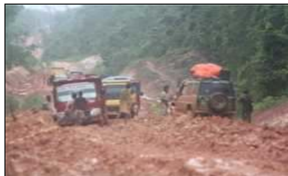
Gambar 2. Rute Jalan Merauke-Ulilin

Didalam dokumen MP3EI koridor ekonomi Papua – Kep. Maluku, peta arahan Kluster Sentra Produksi Pertanian (KSPP) yang ada di Kabupaten Merauke, pada gambar 1 rute jalan merauke –jagebob adalah akses menuju KSPP I, II, dan III. Sedangkan pada gambar 2. adalah akses menuju KSPP IV dan X yaitu sentra produksi kelapa sawit dan pabrik CPO.